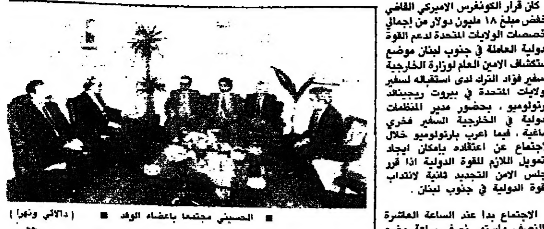
الصيني مجتمعا بضعاء الوفد ■ (الاطي ونهرا)

واعتقد ان الاجتماع الوزاري شهدا لعقد جلسة لمجلس الوزراء. قال نحن نعلمه لاه ورايا. لا مجلسا ورايا. المجلس الوزاري له مفهوم اخر لم نناق عليه بعد.